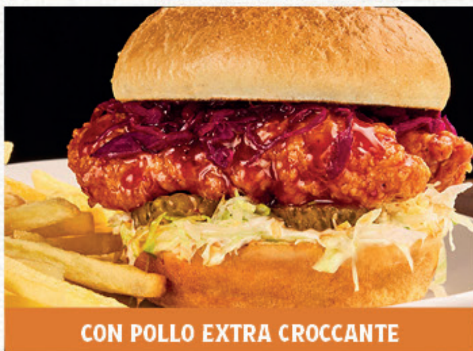
KOREAN CRISPY NEW 13,00 Panino*, strips di pollo* extra croccante, glassati con Korean sauce, insalata iceberg, cappuccio rosso condito, maionese e cetriolini