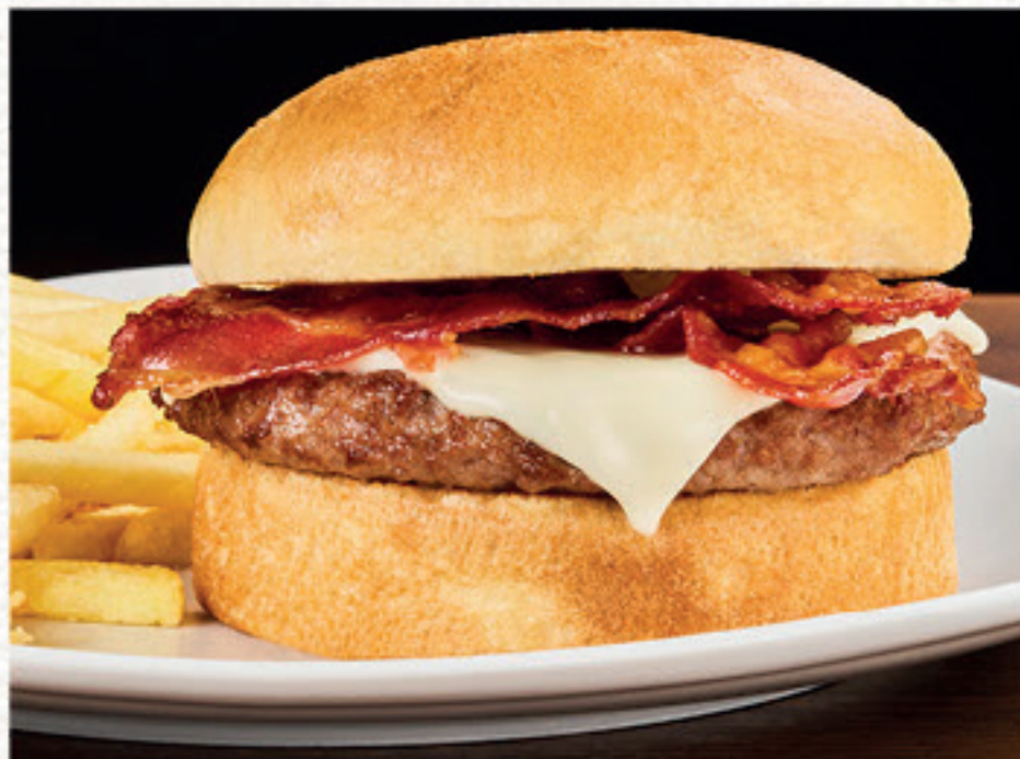
DAKOTA ★ Panino*, hamburger*, formaggio fuso e bacon