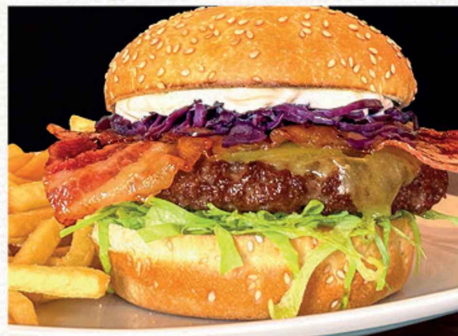
CRAZY BURGER NEW 14,00 Panino con semi di sesamo*, hamburger*, formaggio Cheddar affumicato, bacon, Korean sauce, insalata iceberg, cappuccio rosso condito e maionese