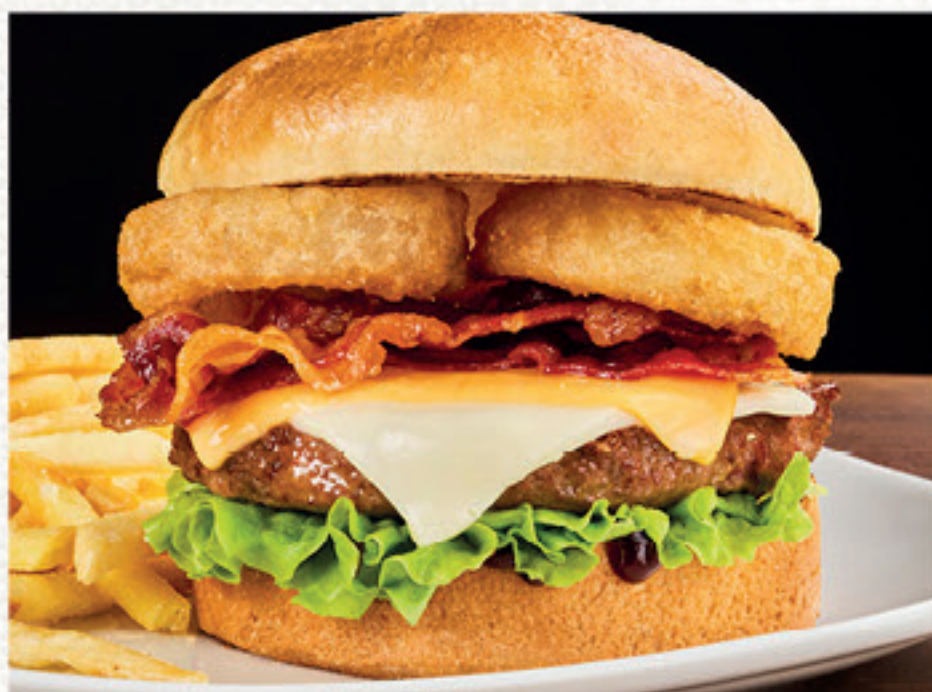
BBQ BURGER Panino*, hamburger*, bacon, mix di formaggi fusi, onion rings*, insalata iceberg e salsa Barbecue, servito con salsa Barbecue