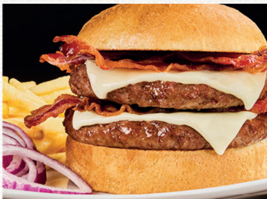
TORO SEDUTO DOUBLE Panino*, doppio hamburger*, doppio formaggio fuso, doppio bacon, servito con cipolla rossa