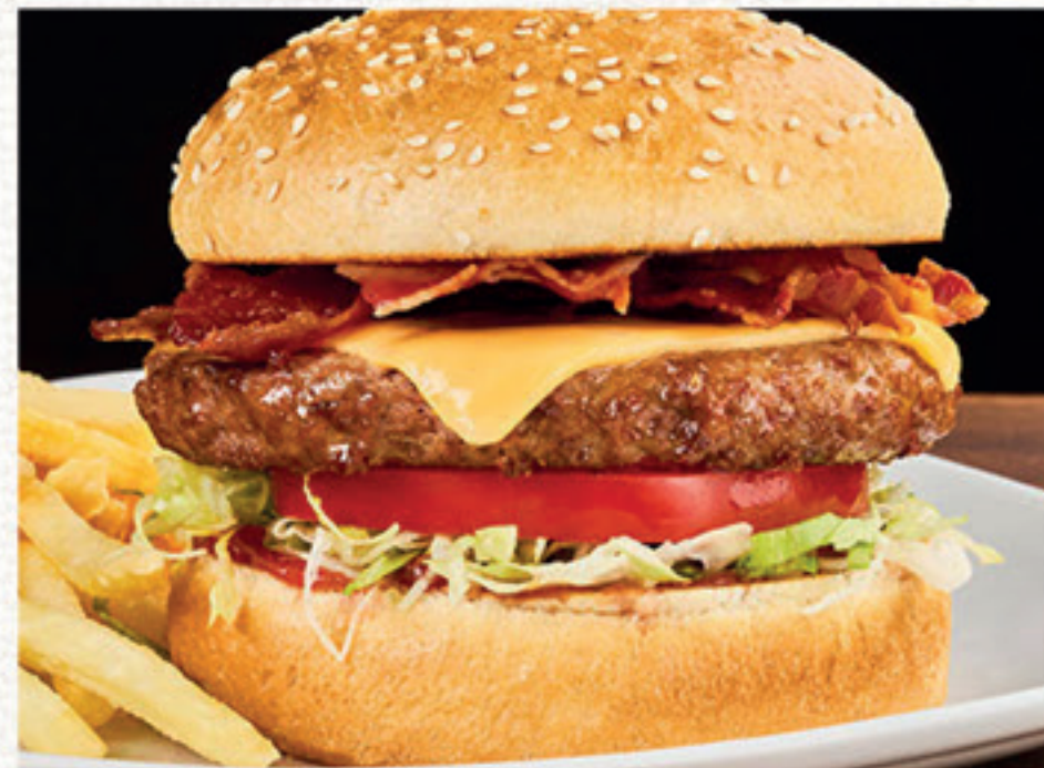
AMERICAN BURGER ★ 12,60 Panino con semi di sesamo*, hamburger*, formaggio fuso con Cheddar, bacon, pomodoro, insalata iceberg e salsa Ketchup