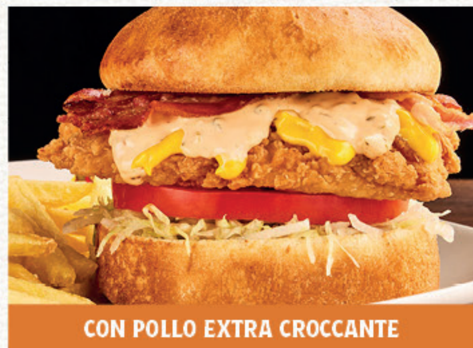
CRUNCHY CHICKEN NEW 12,80 Panino*, strips di pollo* extra croccante, bacon, pomodoro, salsa cheddar, insalata iceberg, salsa Special