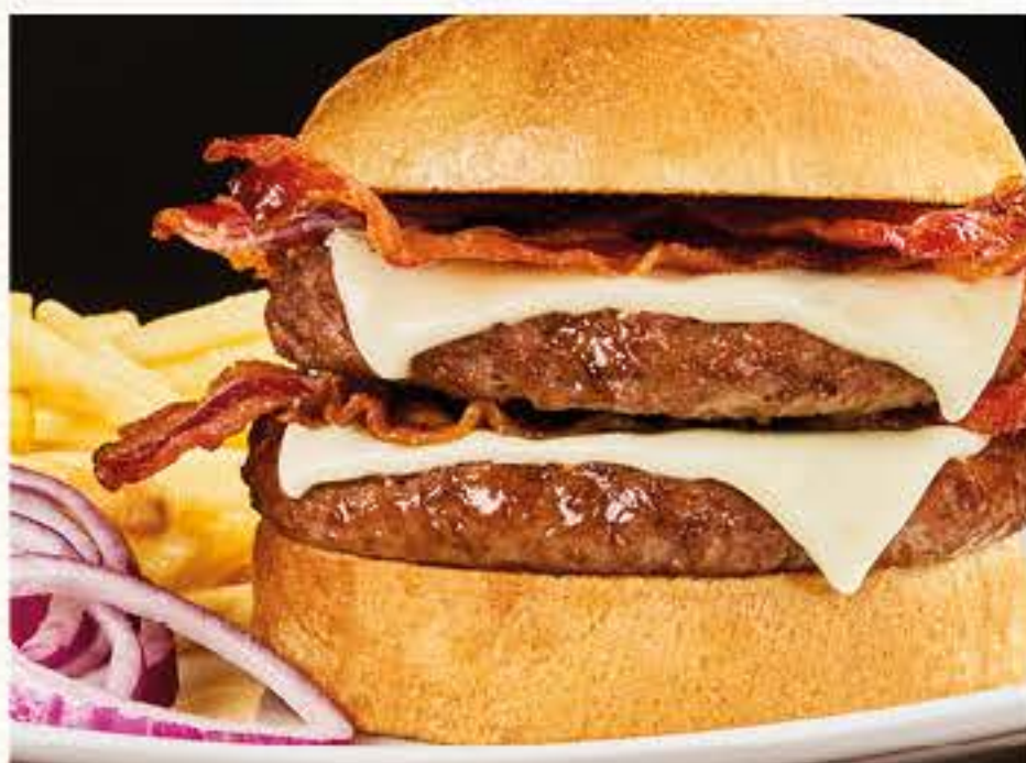
TORO SEDUTO DOUBLE Panino*, doppio hamburger*, doppio formaggio fuso, doppio bacon, servito con cipolla rossa