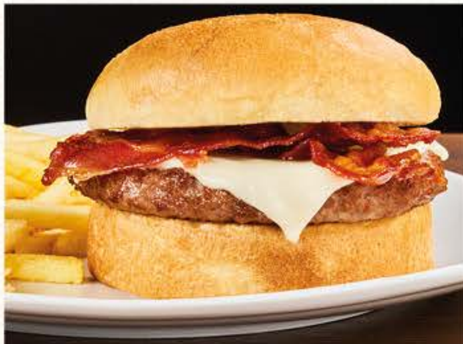
DAKOTA ★ Panino*, hamburger*, formaggio fuso e bacon