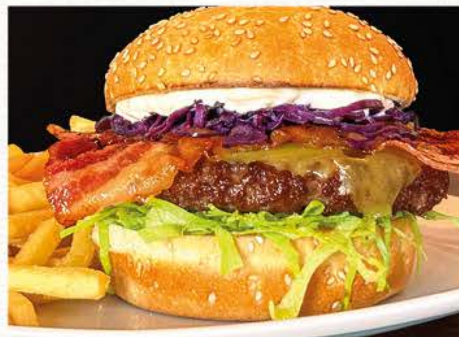
CRAZY BURGER NEW 14,20 Panino con semi di sesamo*, hamburger*, formaggio Cheddar affumicato, bacon, Korean sauce, insalata iceberg, cappuccio rosso condito e maionese