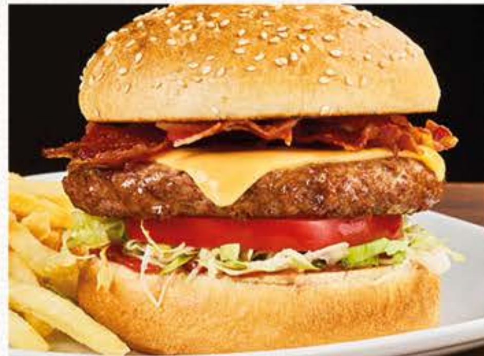
AMERICAN BURGER ★ 12,80 Panino con semi di sesamo*, hamburger*, formaggio fuso con Cheddar, bacon, pomodoro, insalata iceberg e salsa Ketchup